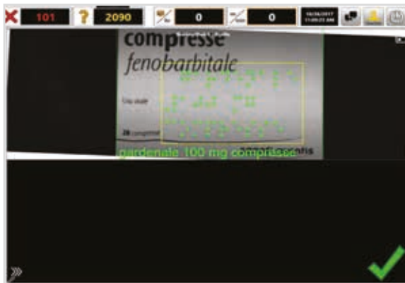
Finestra di ispezione

BrailleChek offre ai produttori di cartone pieghevole la possibilità di offrire ai loro clienti la massima tranquillità eliminando i costi elevati associati alla restituzione di un prodotto difettoso. BrailleChek offre agli utenti un rapido ritorno sull'investimento e un vantaggio competitivo.